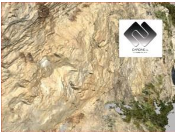
foto 5, modello di dettaglio con fotogrammetria digitale

La progettazione di un sistema di rilievo e/o di monitoraggio comporta una conoscenza approfondita delle strumentazioni da utilizzare e la cognizione dell'obiettivo da raggiungere. Inoltre l'uso delle tecnologie e delle tecniche geomatiche permette di acquisire con celerità dati di fronti rocciosi soprattutto in totale sicurezza. Non secondario è l'integrazione di queste tecniche con l'utilizzo di apparati per la ricezione e il tracciamento di segnali satellitari GNSS (Global Navigation Satellite System). Questi sistemi di navigazione utilizzano satelliti artificiali che forniscono un servizio di posizionamento geospaziale a copertura globale e permettono di georeferenziare i dati acquisiti nei sistemi di coordinate della cartografia istituzionale.