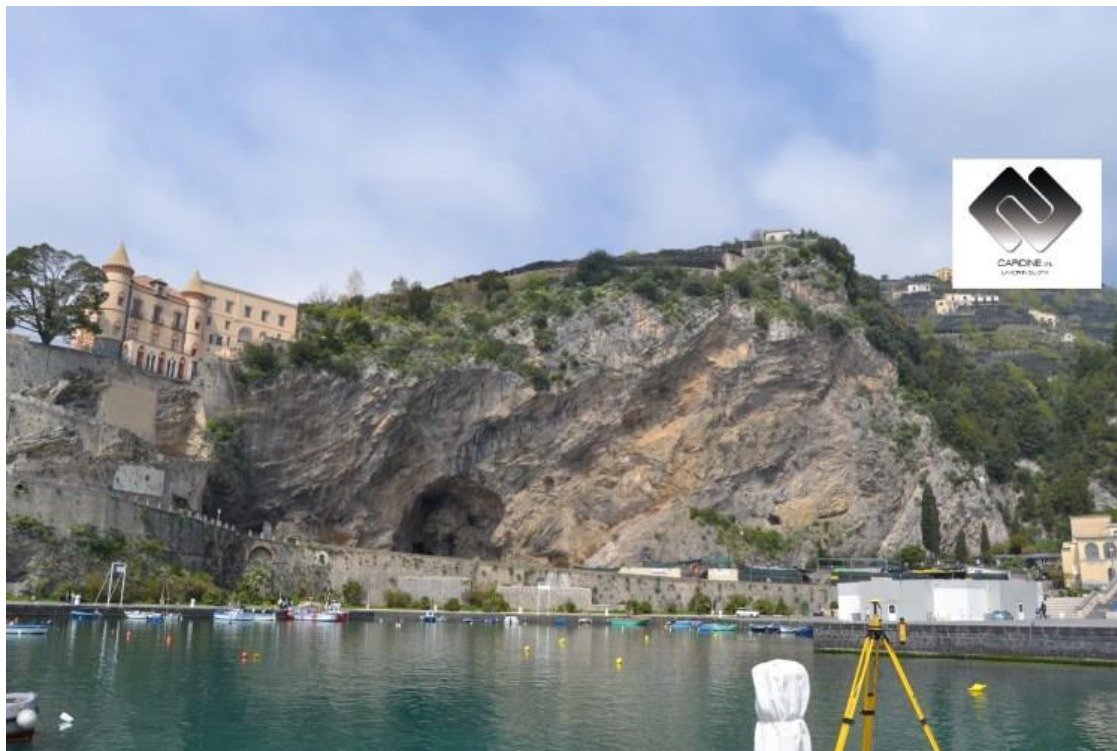
foto 2, rilievi con stazioni totali motorizzate laser (costone roccioso Comune di Minori-Sa)

Inoltre comporta stazionamenti in una o più posizioni tali da poter avere a vista il fronte roccioso mentre i limiti di distanza sono dettati dal modello e dalla marca della strumentazioni che vanno da pochi metri a svariati chilometri. I risultati sono punti di massima accuratezza nelle tre coordinate xyz.