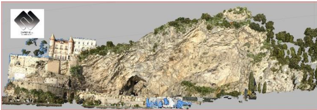
foto 4, modello di fotogrammetria digitale realizzato con SAPR (costone roccioso Comune di Minori-Sa)